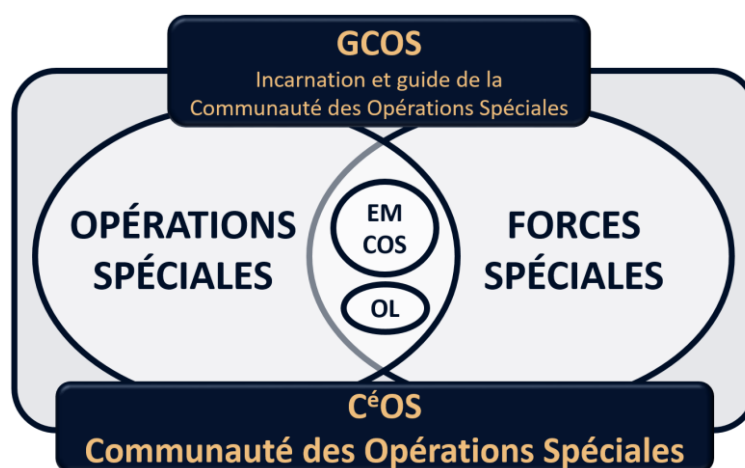
Schéma 2 : La Communauté des opérations spéciales (CéOS)